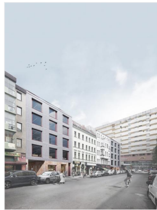
Bauprojekt "Adil & Berta 8" ©LindBaenkruzEgg