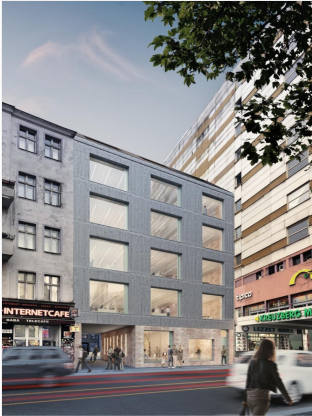
Bauprojekt "Adil & Berta 5"