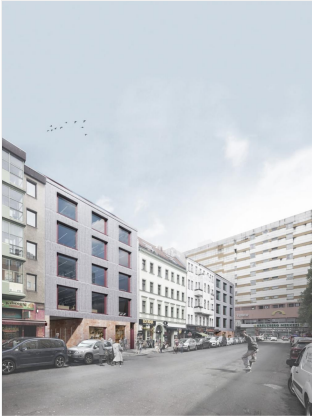
Bauprojekt "Adil & Berta 8"