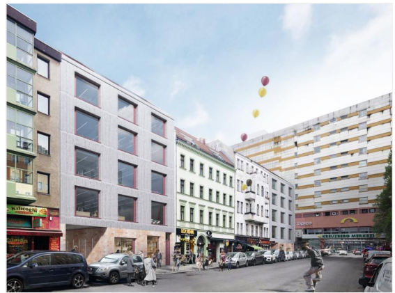
Objektansicht Adil&Berta Nr.5 & 8